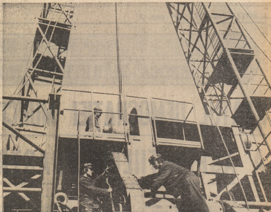
Intreprinderea „1 Mai” — Ploiești

ORGAN AL COMITETULUI CENTRAL AL UNIUNII TINERETULUI COMUNIST