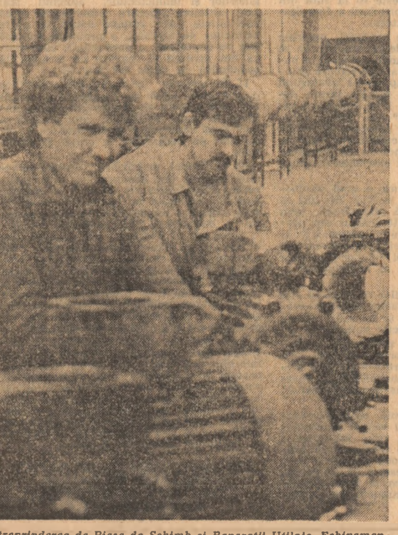
Întreprinderea de Piese de Schimb și Reparații Utilaje, Echipamente Electrotehnice Miniere din Petroșani

este un ținut al paradoxurilor. Iată încă unul dintre ele: aici se înșurlează regimul de precipitații cel mai scăzut de pe pîmîntul nostru, cu aproximativ 100 ml pe metru pătrat mai puțin. Astfel, irigațiile terenurilor agricole din Delta se arată a fi o necesitate stringentă. Într-o lume a apei, apa are adesea valoarea greutății sale în aur.