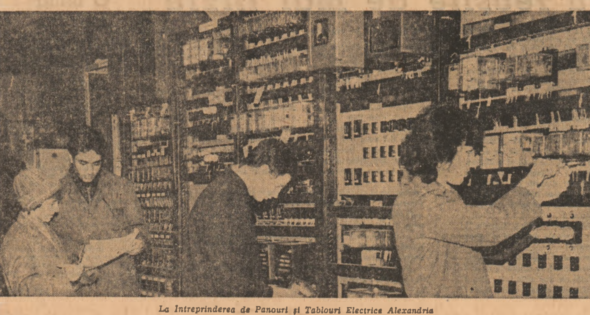
La Intreprinderea de Panouri și Tablouri Electrice Alexandria