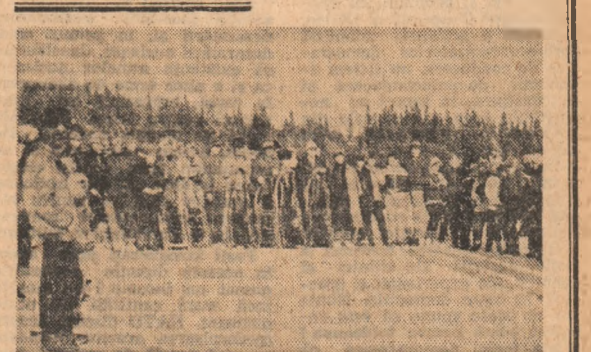
Înainte de start