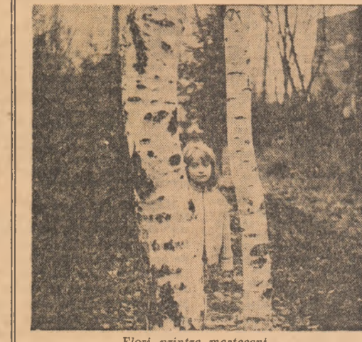
Flori printre mesteceni...