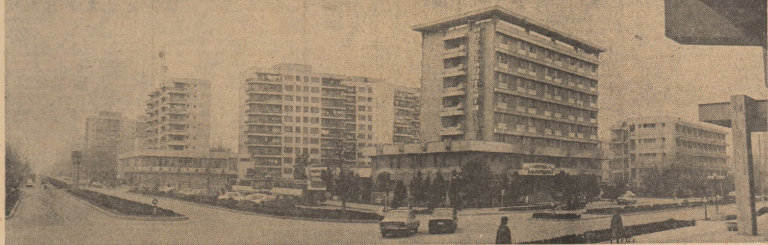
Imagine din municipiul Stobocia