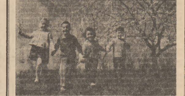
Da! E primăvară!