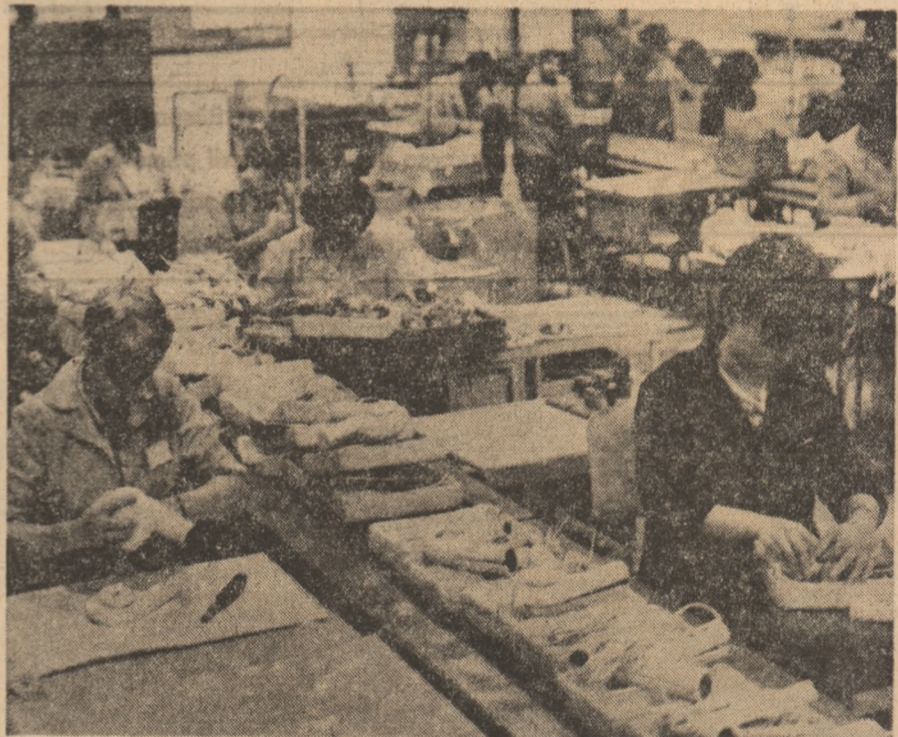
I.P.E.E. „Electroarges” — o mare bine cunoscută în întreaga lume, o întreprindere în care înnoirea produselor și sporirea competitivității acestora își află concretele, consecvent, la fiecare loc de muncă