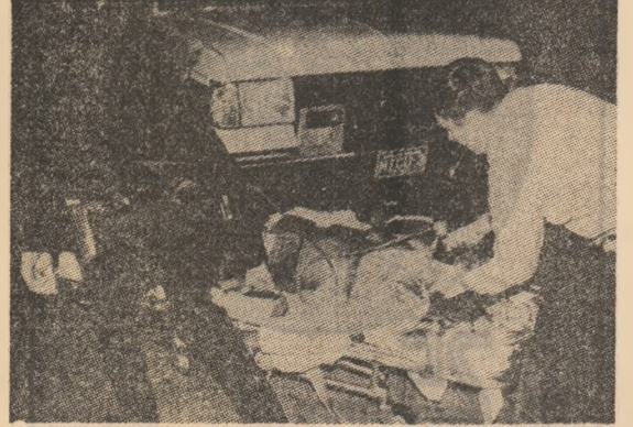
Valul de violență de pe piața drogrilor determină permanent apariția unor noi victime

credibilitii nivel de 90 de asasinări la sute de mii de locuitori în S.U.A. Și, în condițiile în care la 1 ianuarie s-a înregistrat în jur de 1.000 omucideri în condițiile în care populația totală este de 625.000 de persoane. Această rată este ceva mai înaltă chiar și decît cea a Detroitului, cunoscut multă vreme ca fiind capitala asasinatelor în S.U.A. Și, în condițiile în care la 1 ianuarie s-a înregistrat în jur de 1.000 omucideri în condițiile în care populația totală este de 625.000 de persoane. Această rată este ceva mai înaltă chiar și decît cea a Detroitului, cunoscut multă vreme ca fiind capitala asasinatelor în S.U.A. Și, în condițiile în care la 1 ianuarie s-a înregistrat în jur de 1.000 omucideri în condițiile în care populația totală este de 625.000 de persoane.