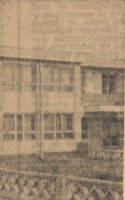
O plimbare pe lac.