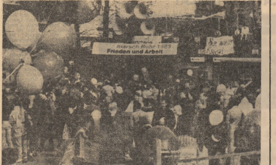
Aspect din timpul marșului de primăvară, devenit tradițional, pentru pace și dezarmare, care s-a desfășurat recent în orașul Essen, din R.F.G.

„o cale eronată care nu poate fi decît o surșă de decepții, ducînd la o sărăcie a vieții spirituale și materiale”. ● EFORTURILE în direcția păcii, realizate de zărmării și egalității economice constituie o sarcină prioritară a mișcării de nealiniere — s-a subliniat în cadrul „mesaj rotund” indo-tucului cu tema „Problemele și telerile mișcării de nealiniere”, care s-a desfășurat, timp de două zile, la New Delhi.