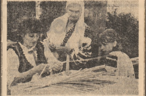
Ștafeta unui meșteșug...