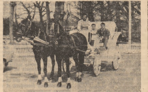
La drum, ca pe vremuri...