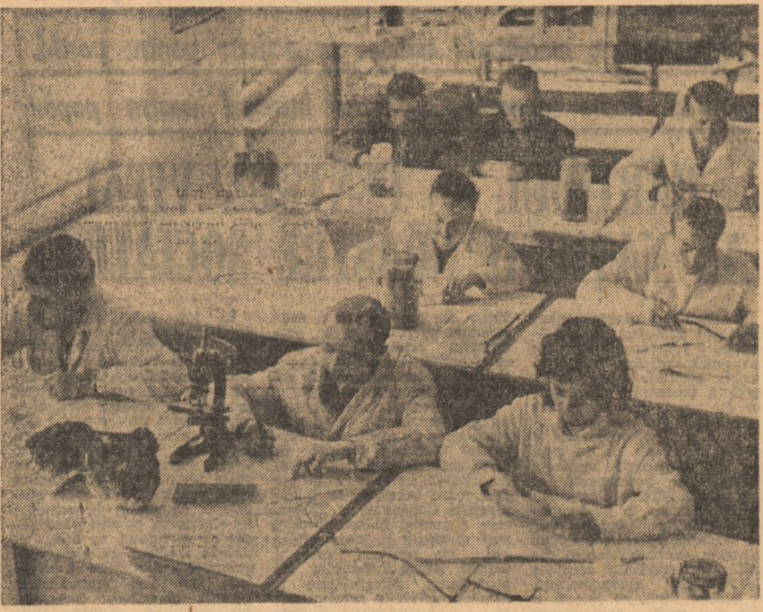
Pe agenda vieții universitare