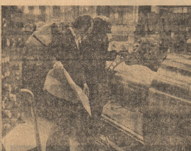
Tribuna secretarului U.T.C.

Au trecut cîțiva ani buni de la intrarea în funcțiune a celei mai moderne și reprezentative unități economice de pe platforma industrială a municipiului Cluj-Napoca: Combinatul de Utlaj Greu. In timp, efortul de investiție tehnico-stiințifică și umană a fost considerabil, ceea mai mare parte a acestuia revenind tineretului. De altfel, și în momentul de față, ponderea forței de muncă o reprezintă tinerii. Sigur, este vorba de muncă de calitate, cu un nivel ridicat de profesionalitate, majoritatea a acestora reprezentînd ramurile de vîră ale tehnicii. Așa este normal, așa este firesc, într-o întreprindere care și-a cîștigat dreptul la o existență de sine stătătoare în intervalul ultimului deceniu de activitate.