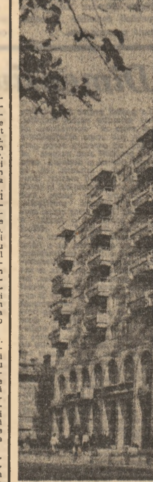
Găști — efigii urbane