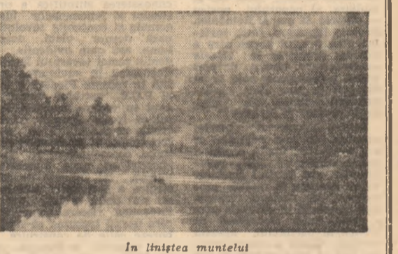
În înălțea muntelui