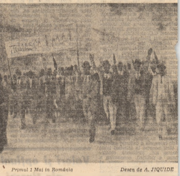
Primul 1 Mai în România

Prezența mișcării muncitorești, socialiste din România încă de la primul 1 Mai cu manifestările bine organizate, cu un proletariet pătruns de semnificația revoluționară a acestei zile, releva existența în țara noastră a unei clase muncitoare consistente de mîinea și tehnici și de încredința solidarității internaționale. Relevînd entuziasmul cu care a fost sărbătorit primul 1 Mai în România, ziarul „Munca” din 12 aprilie 1890 consemna: „În această zi s-a arătat tuturor că un alt popor s-a ridicat în țară, o altă clasă de oameni care dreptul la viața politică și socială și în sfîrșit partidul muncitorilor are temeinice baze și adînc rădăcini în inima poporului”. O afirmare justificată și deplin argumentată întrucît mișcarea muncitorească și socialistă din România, moștenitoare a tezaurului valoros de idei revoluționar-democratice de la 1848, a evoluat rapid urcînd treptat organizat în înaltul și înaltul similar cu cel internațional de la Asociații profesionale de ajutor reciproc (1834), Cercuiri socialiste (1869), Clubul muncitorilor (1887), Clubul muncitorilor (1890) spre Partid (1893).