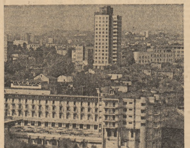
R.P. BULGARIA — Verticale editate, în vechiul oraș Veliko Tirnova

NATIUNILE UNITE 20 (Agerpres) — Consiliul de Securitate al O.N.U., reunit la sediul din New York al Națiunilor Unite, a continuat dezbaterile organizate în urma plingerii Afgazanului cu privire la agresiunea militară și intervențiile străine în treburile sale interne. În cadrul sedințelor de miercuri, consacrată acestor probleme, vorbitorii au relevat necesitatea reesențării stricte de către toate părțile a acordurilor de la Geneva privind soluționarea de cale pașnică a problemei afgane.