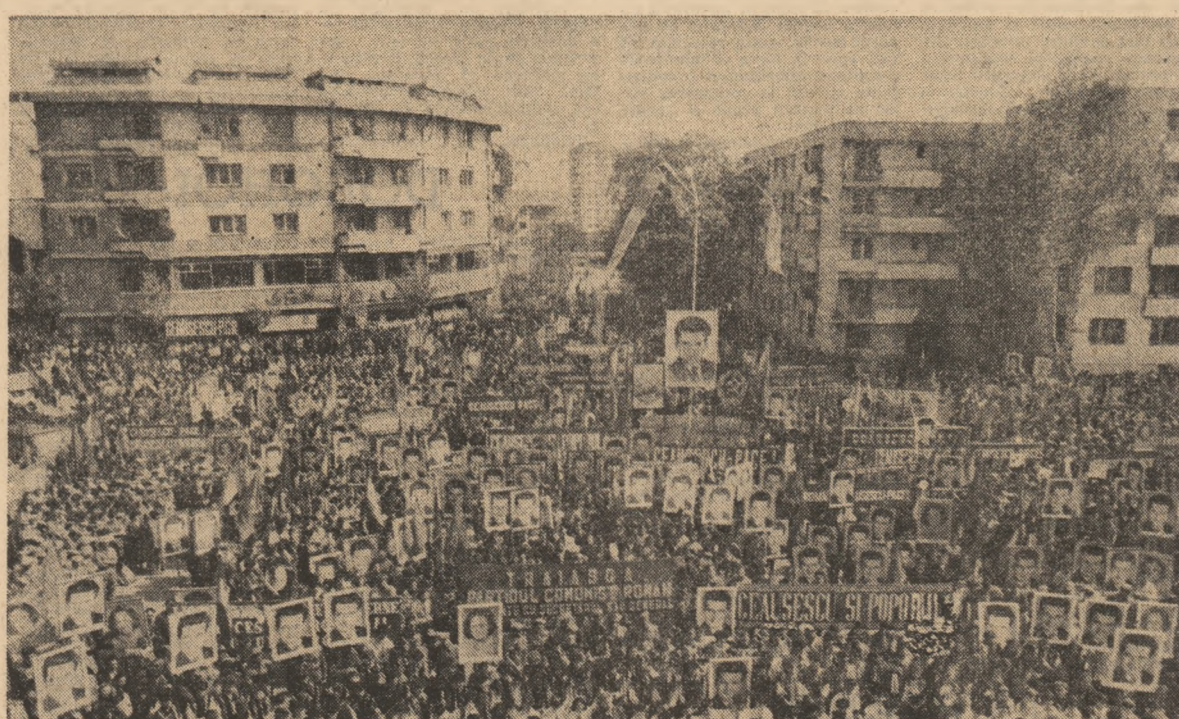
Imagine de la adunarea populară desfășurată în Piața „Mihai Viteazul” din Suceava

Conștienți de deplin de marile răspunderi ce ne revin, ne angajăm solemn, mult stimate și iubite tovarășe Nicolae Ceaușescu, să urmăm neabătut luminosul exemplu al vieții și activității dumneavoastră eroice, să muncim cu răspundere,