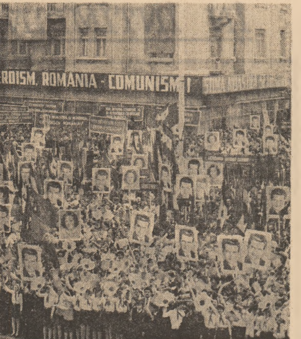
Marea adunare populară din Timișoara

Cu inimile pline de bucurie, cu înalte și vibrante sentimente patriotice, noi, constructorii de mobilă din Arad, asemenea întregului popor, am luat cunoștință de lichidarea datoriei externe a țării, în condițiile dezvoltării economiei naționale, ridicării continue a nivelului de trai material și spiritual al oamenilor muncii. Această victorie de prestigiu marchează