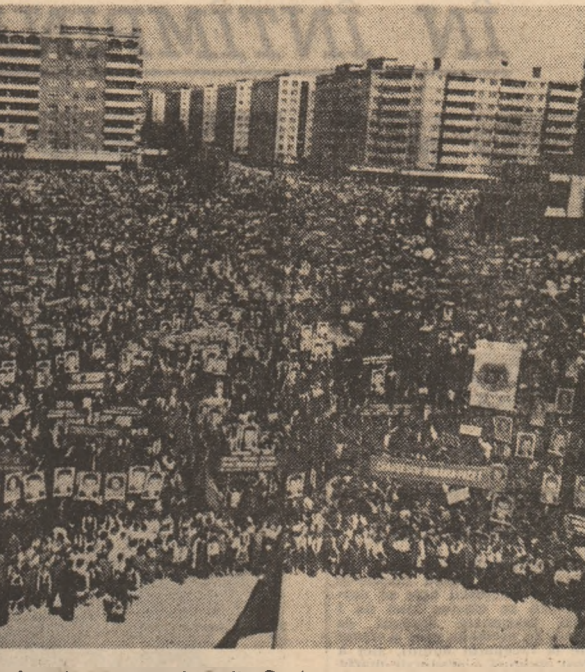
La adunarea populară din Oradea

În contextul puternicelor transformări înnoitoare din municipiul Oradea și județul Bihor și întreprinderea „Sinteza” a cunoscut o dezvoltare impetuoasă. De fapt ea s-a clădit din temelii, alcătuind astăzi o puternică platformă a chimiei românești în care muncesc și crează, în fruntea prietenilor, muncitorii și specialiștii, în care se realizează produse de înalt nivel tehnic și calitativ necesare economiei noastre naționale și destinate exportului.