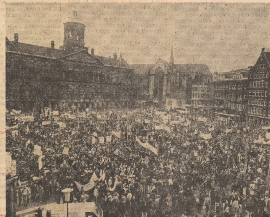
Demonstrație a tineretului francez împotriva creșterii șomajului, pentru crearea de noi locuri de pregătire profesională