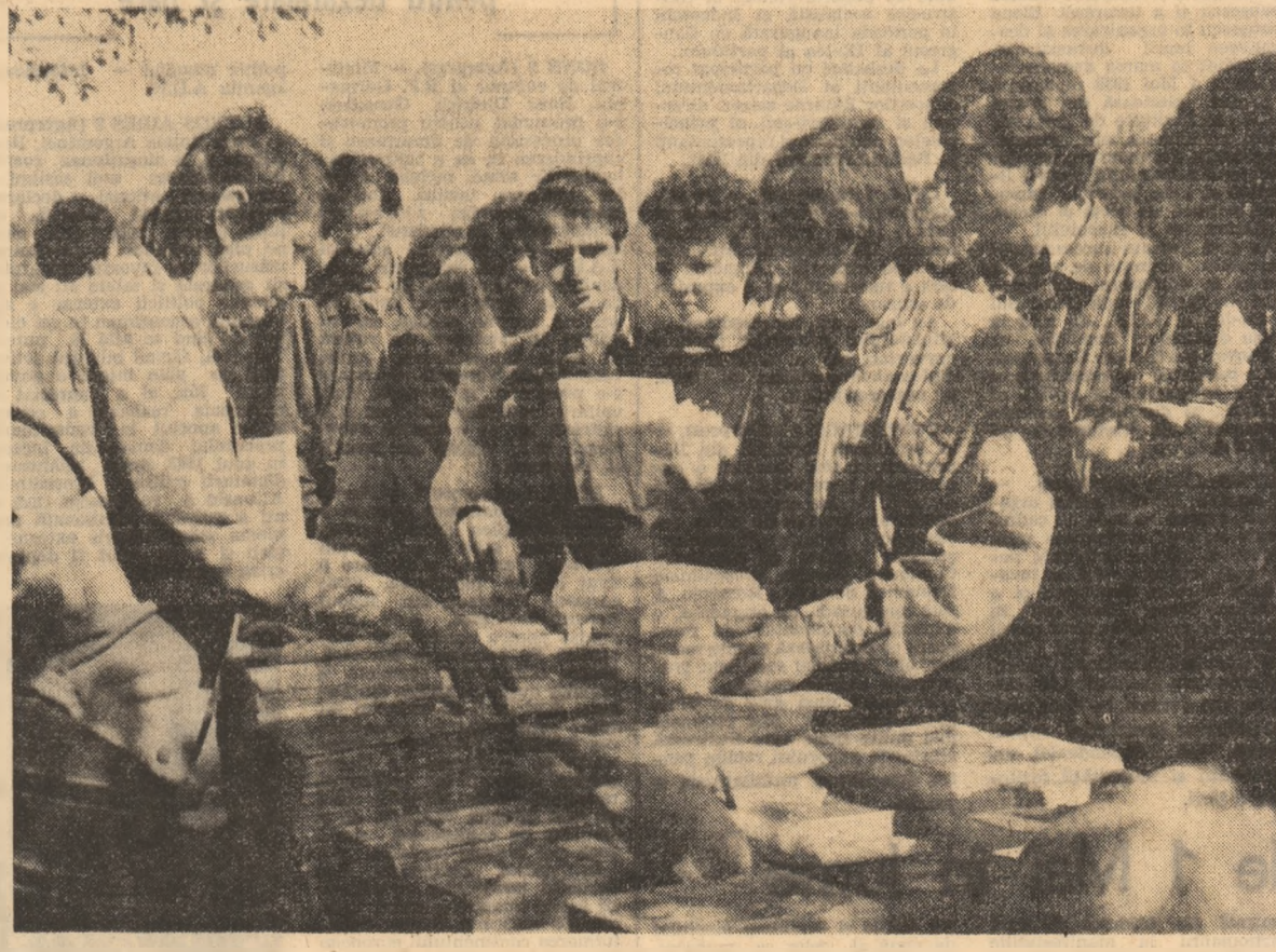
Intin în fata unui public atât de numeros și atât de cald”, ne spune ea.