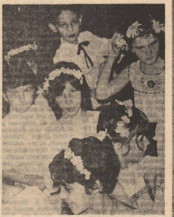
Florile copilăriei.