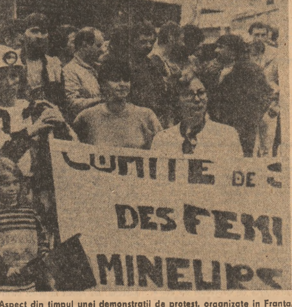
Aspect din timpul unei demonstratii de protest, organizate in Franta, fafa de deteriorarea conditiilor de munca si viata