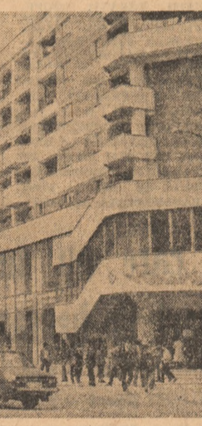
Municipiul Tg. Jiu