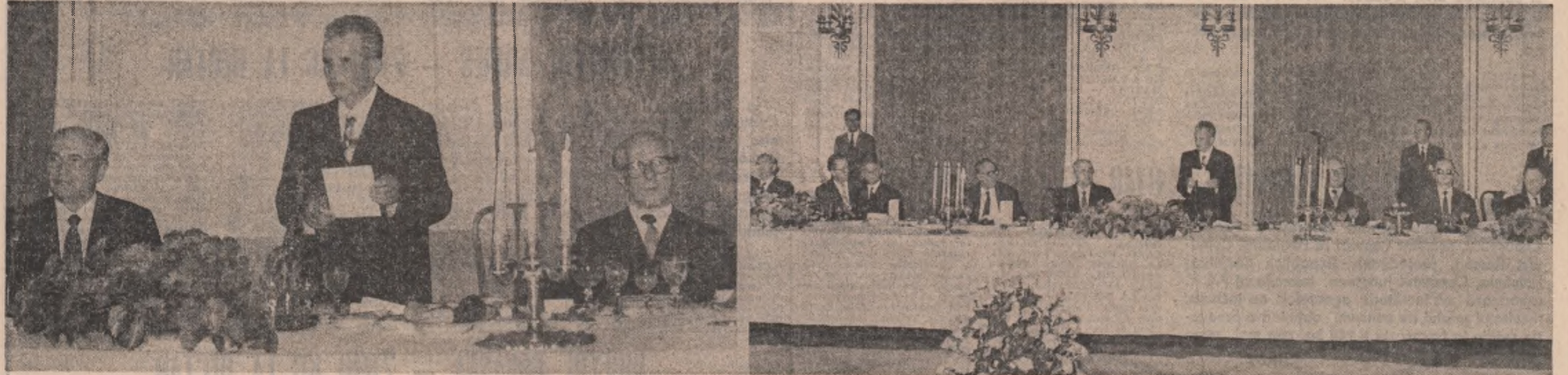
Tovarășul Nicolae Ceaușescu, secretar general al Partidului Comunist Român, prezidinte Republicii Socialiste România, a oferit, vineri, un dîneu oficial în onoarea delegațiilor prezente la Consfățuirea Comitetului Politic Consultativ al Statelor