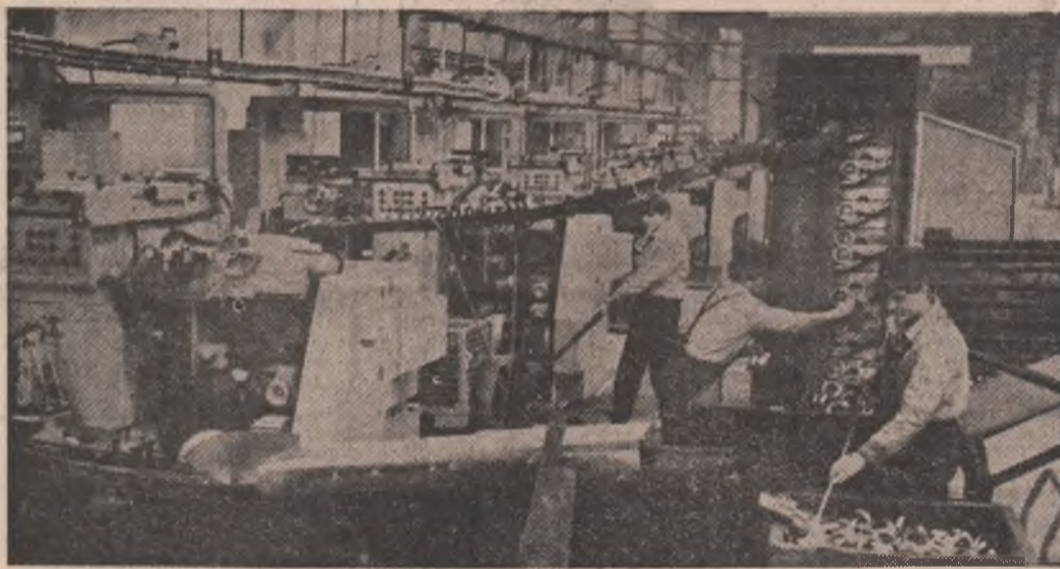
Intreprinderea de Rușeni — Suceava