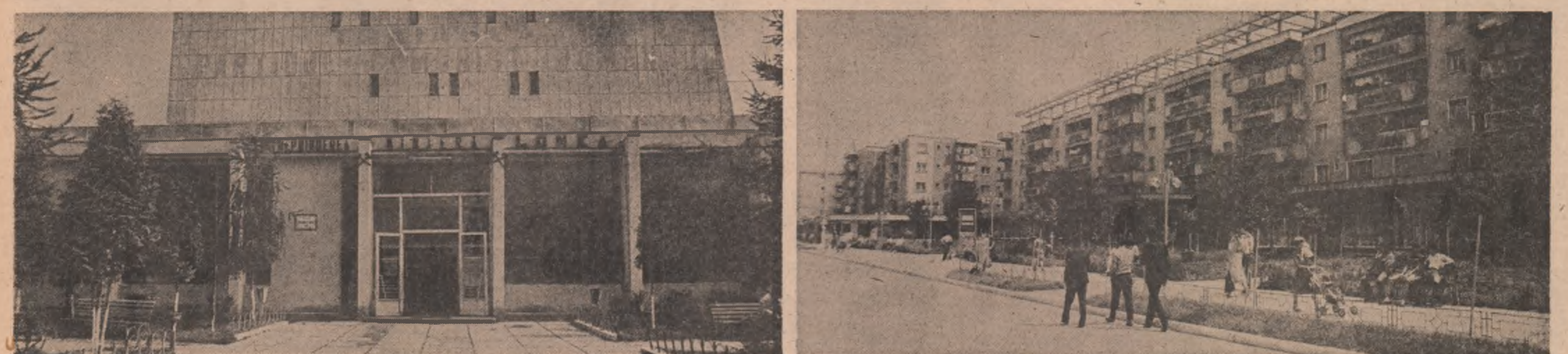
Pagină realizată de DORIN GHETA

Mineritul modern, necontenită introducere a noi tehnici și tehnologii în activitatea productivă, din industria extractivă a cărbunelui impun, solicită din partea minerilor o calificare mereu mai înaltă, o perfecționare profesională continuă și policalificarea chlap a celor care își desfășoară activitatea în subteran. Minerul de azi este un ade-