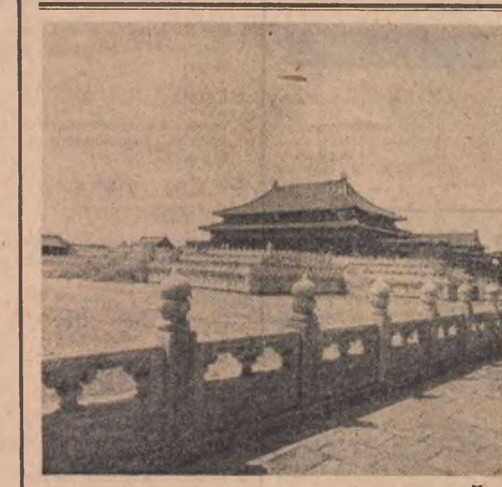
NOTE DE DRUM DIN R.P. CHINEZĂ