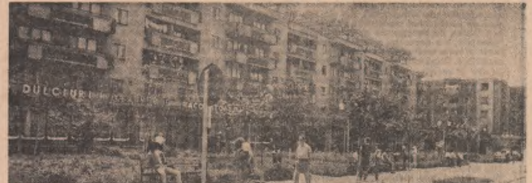
Imagine din orașul Petriș-Lonea