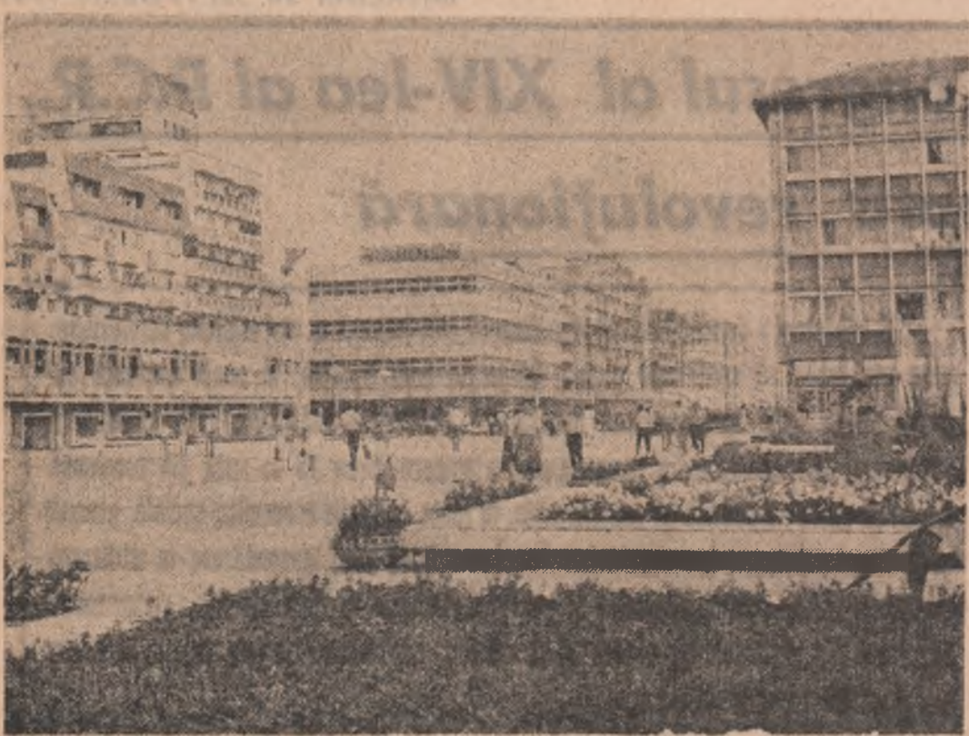
Construcții noi la Tirgoviste