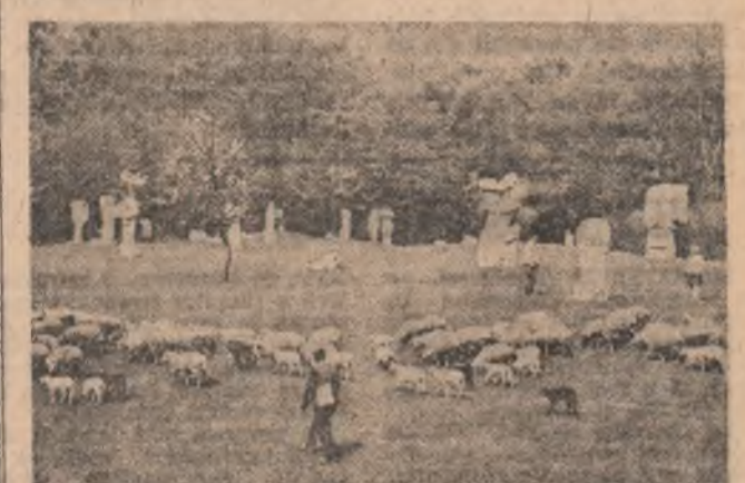
Legendă și poezie în tabăra de la Măgura—Buzău.