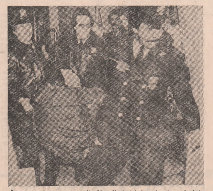
O nouă arestare pe străzile New-Yorkului, imagine intrată deja în cotidian, care nu mai surprinde pe nimeni

Lumea occidentală devine, din ce în ce mai mult, scena unor violente seisme economice și sociale, ale căror victime predilecte sînt adesea tinerii sub 25 de ani. Accentuarea crizei economice, frînarea dezvoltării au avut drept consecință majoră reducerea severă a locurilor de muncă și marginalizarea a zeci de milioane de tineri. Lipsiți de drepturi firești, elementari de încredere, privați de majoritate a tinerilor dezamăgiți, debusolați, alunecă pe panta abuzată a consumului de droguri, a violenței, a sectarismului. La început un apanaj al gangsterilor, violența a pătruns impecabil în modul de viață al tinerilor occidentali, folosindu-se de o încreștere recurentă, de la filme unde agresivitatea este mereu în prim-plan, pînă la veritabile arme de foc, oferite la prețuri foarte accesibile. Folosită ca sursă de venit, violența a pătruns cantacual, acaparînd tinerii din categoriile sociale cele mai diverse, de la asanumii "copii ai străzii" pînă la cei ce frecventează colegiile și instituțiile de învățămînt superior.