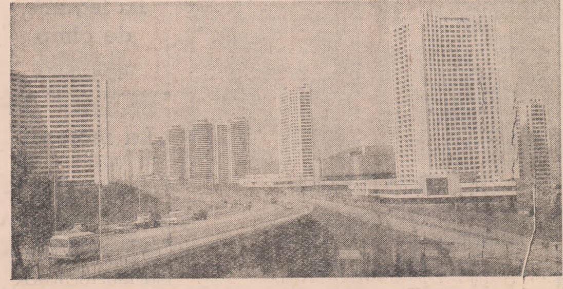
R.P.D. Coreeană: Imagini din noul cartier Kwangbok al capitalei țării, Phenian

TI RANA 9 (Agerpres). - Cu prilejul unei mari adunări populare organizate în districtul Tropoja, din nordul țării, în preajma aniversării a 45 de ani de la întemeierea republicii, Ramiz Alia, prim-secretar al C.C. al Partidului Muncii din Albania, președintele Prezidiului Adunării Populare a R.P.S. Albania, a evidențiat cu încredință realizările de bază pe care le-a obținut poporul albanez în urma aplicării politicii economice de dezvoltare în condițiile socialiste. Alia a subliniat că aceste realizări sunt rezultatul aplicării politicii economice de dezvoltare în condițiile socialiste și al dezvoltării științei și tehnicii. El a arătat că în urma aplicării politicii economice de dezvoltare în condițiile socialiste, poporul albanez a obținut importante realizări în domeniul producției și distribuției mărfurilor, în domeniul construcției și al dezvoltării infrastructurii, în domeniul învățării și al dezvoltării științei și tehnicii. El a arătat că aceste realizări sunt rezultatul aplicării politicii economice de dezvoltare în condițiile socialiste și al dezvoltării științei și tehnicii.