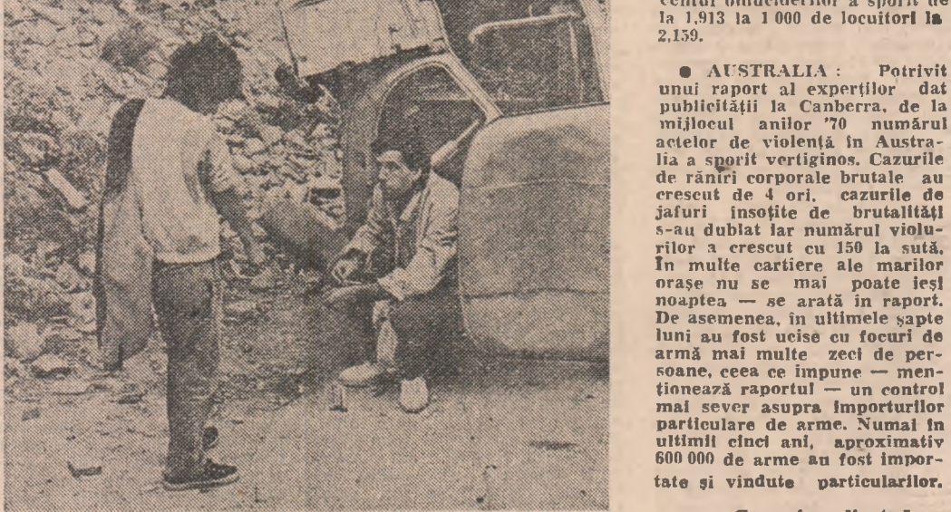
De la droguri la crimă nu e decît un pas...

JAPONIA: Numărul crimelor și delictelor comise în această țară în primele șase luni ale anului trecut a atins un nivel record pentru perioada postbelică, cifrîndu-se la 775.000 de cazuri. Potrivit unui raport publicat de Agenția Națională a Poliției, circa 36.000 de crime, delict și infracțiuni au fost comise de 20.000 de