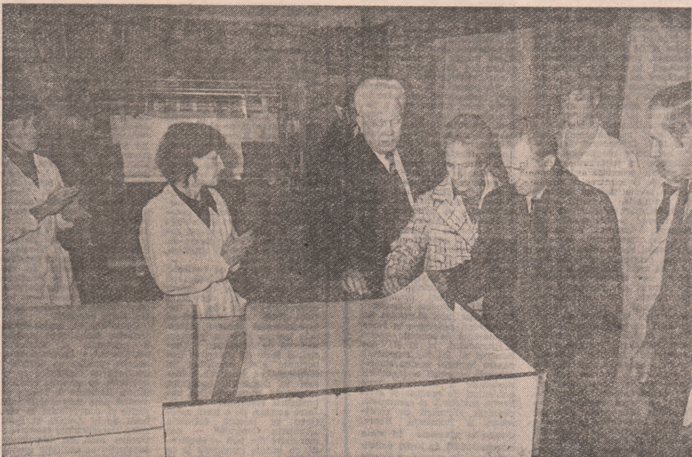
(Urmare din pag. a 4-a)

foști obținute o serie de rezultate bune, dar trebuie să se acorde în continuare mai multă atenție problemelor privind creșterea randamentelor, reducerea consumurilor de materii prime. S-a subliniat necesitatea de a se acționa pentru dublarea cantității de celuloză obținută dintr-o tonă de masă lemnoasă, pentru ridicarea nivelului calitativ al producției, concomitent cu reducerea consumurilor materiale și energetice, cu sporirea productivității muncii. Numai astfel putem spune că progresăm cu adevărat, și aceasta este în strânsă legătură cu ceea ce discutăm de multă vreme