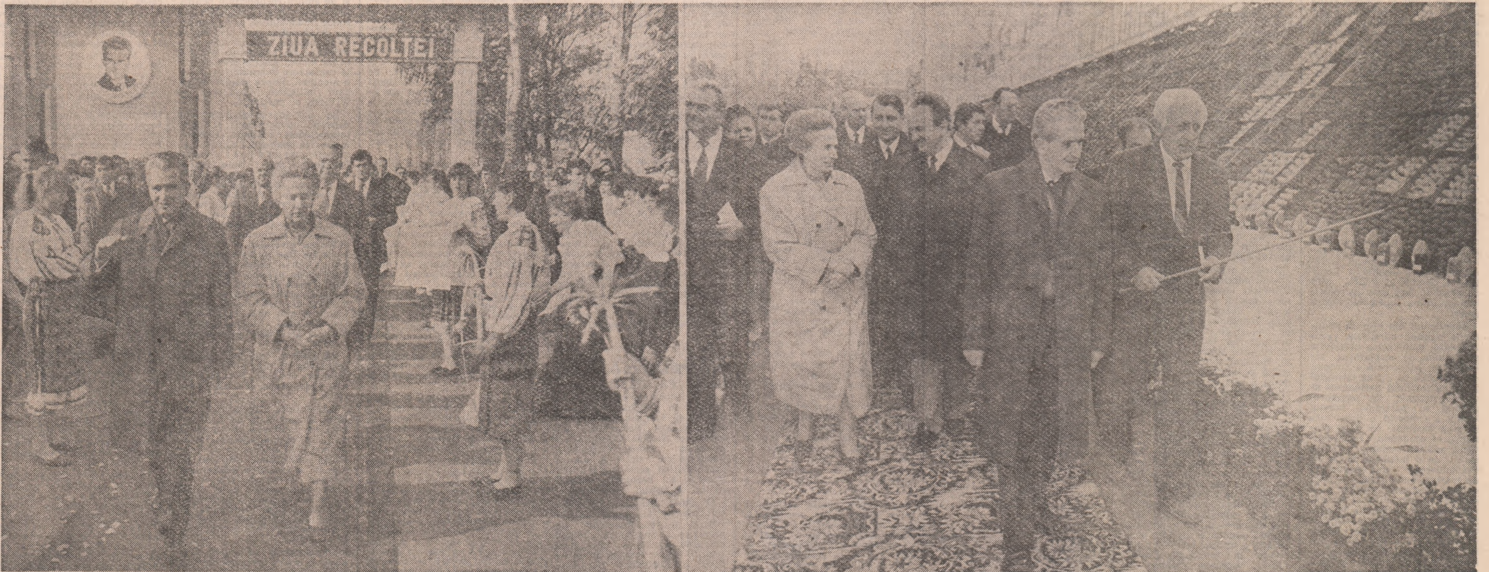
(Urmasor din pag. 1)

la marea adunare populară din municipiul Brăila, consacrată „Zilei recoltei”