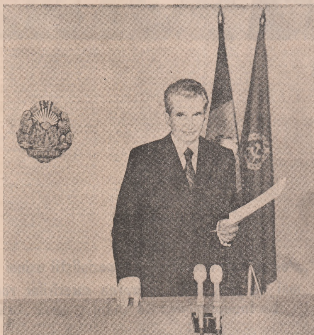
Nicolae Ceaușescu la posturile de radio și televiziune.

Armata și-a îndeplinit pe deplin datoria față de patrie, față de popor și cuceririle socialiste!