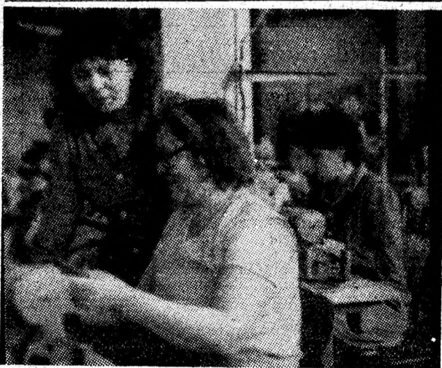
Întreprinderea de Confecții Vulcan — unitate tânără unde elanul vîrstei se îngemănează cu hotărîrea și pasiunea muncii creatoare.

Din dezbateri s-a desprins hotărîrea fermă a întregului colectiv de a face totul pentru respectarea termenelor de punere în funcțiune a noilor capacități de producție, de a-și onora prin fapte calitatea de colectiv al unei mine model. Această voință colectivă a fost exprimată de adoptarea unui amplu program de măsuri politico-organizatorice și tehnico-economice prin înfăptuirea căruia se vizează realizarea exemplară a tuturor indicatorilor de plan, în condiții de eficiență economico-financiară sporită.