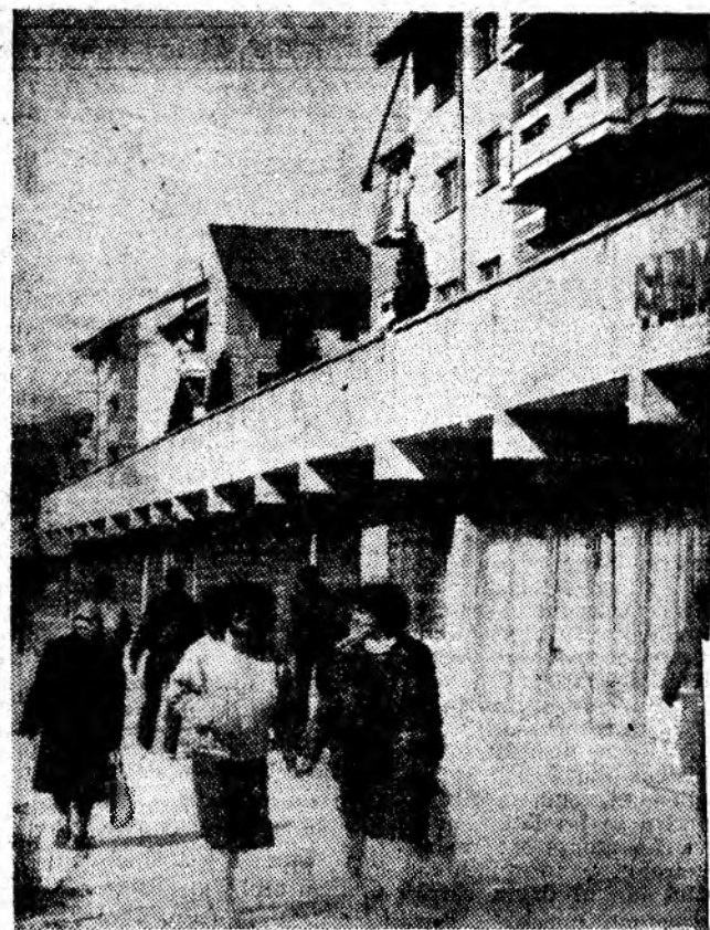
La braț cu tineretea pe bulevardul însoțit și modern al reședinței de municipiu.

În frunte se află brigăzile sectorului II, care, de la începutul acestei luni au extras și livrat, peste sarcinile de plan ale perioadei, mai bine de 2100 tone de cărbune. În acest clasament al hărniciei minerești urmează sectorul I, care înregistrează în iulie un plus de producție de aproape 1700 de tone, plusul sectorului V fiind de 1200 de tone. (S.B.)