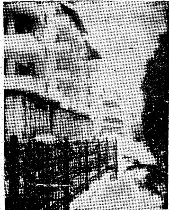
Silueta modernă a noilor construcții ridicate în noul centru civic al orașului Petrla.

Lucrurile nu stau mai „pe roze” nici la Petrosani, unde, chiar pe artera prin-cipală de circulație, nu se văd semne de intervenție