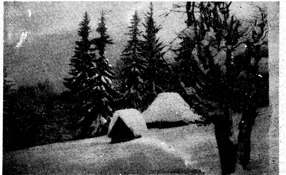
Stine și troiene la Straja.