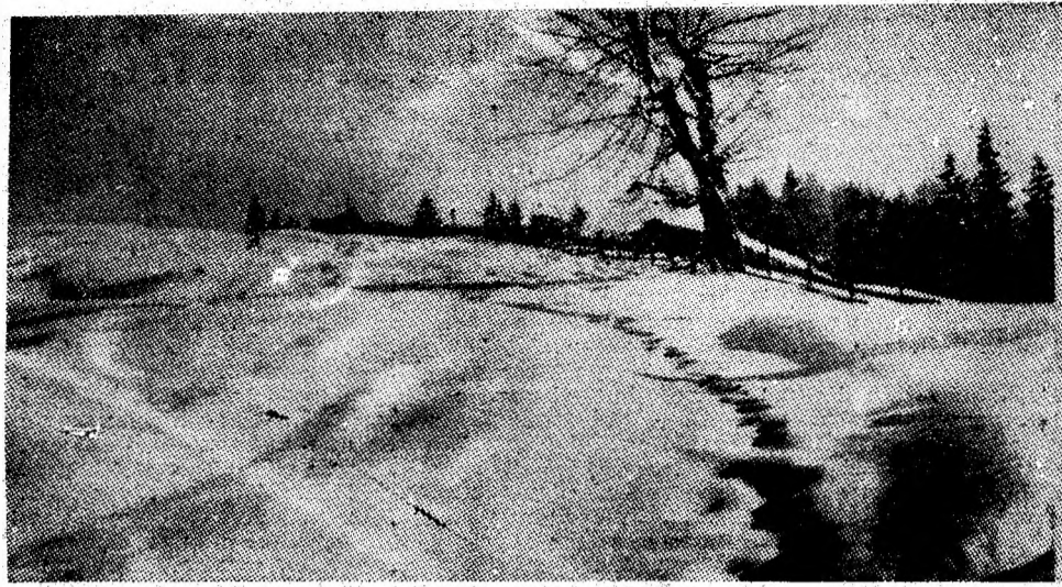
Urme pe zăpezile lui ianuarie.