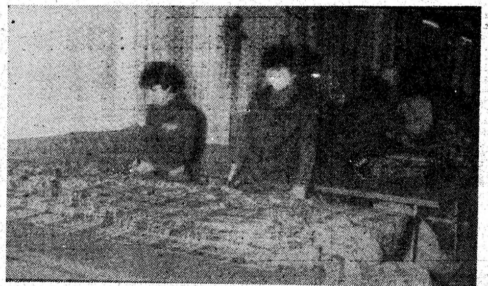
La întreprinderea de confecții din Vulcan se pregătesc noi modele în pas cu cerințele beneficiarilor.