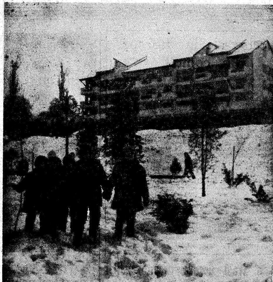
Tineretea orașului — prezentă la tot pasul.

Reușita minieră de la Uricani semnifică preocuparea stăruitoare a colectivului minei de a asigura valorificarea maximă a capacităților de producție, a dotării tehnice moderne, în vederea realizării sarcinilor de extracție sporite ce îi revin în cel de-al doilea an al cincinalului. (I.D.)