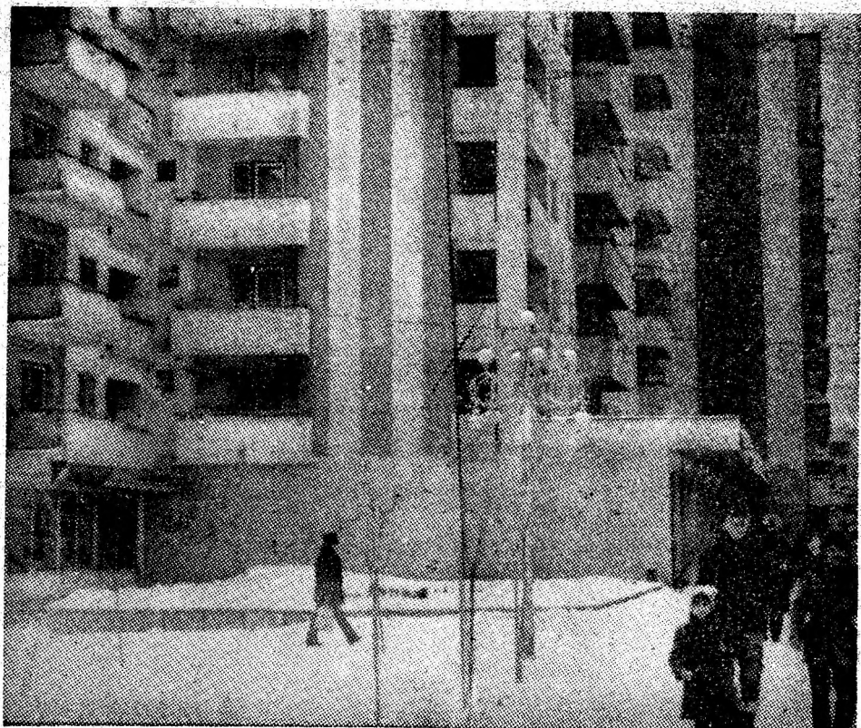
Construcțiile de locuințe moderne de pe bulevardul Victoriei întregesc peisajul arhitectonic al orașului Vulcan.