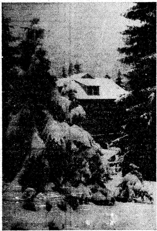
Cabana Straja Lupeni.