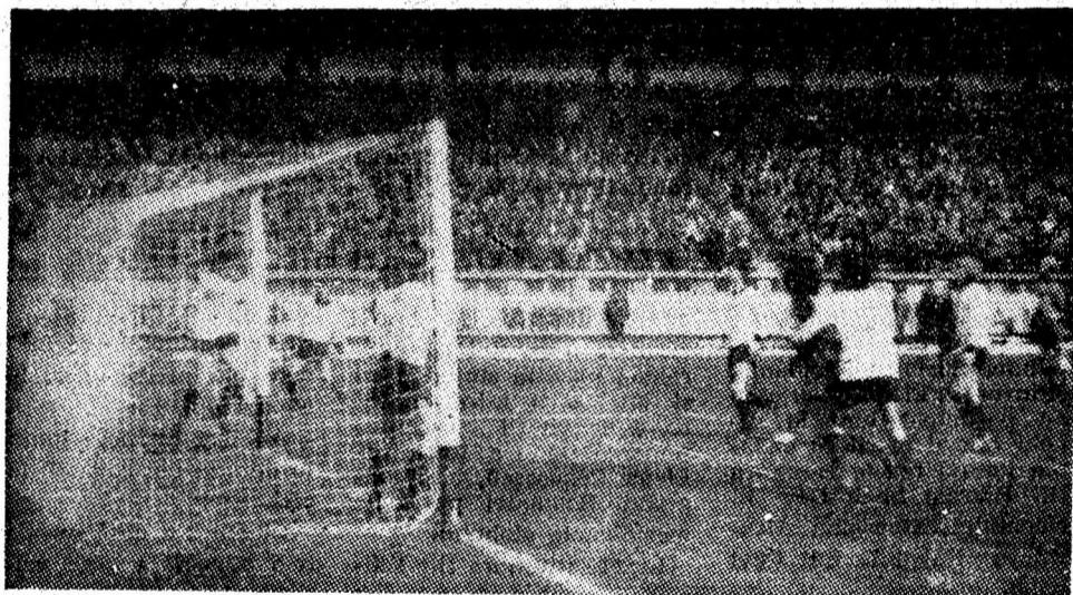
Aspect din timpul partidei Jiul Petroșani — „U” Cluj-Napoca.