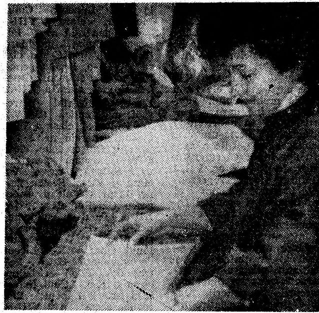
În atelierul de creație al fabricii.