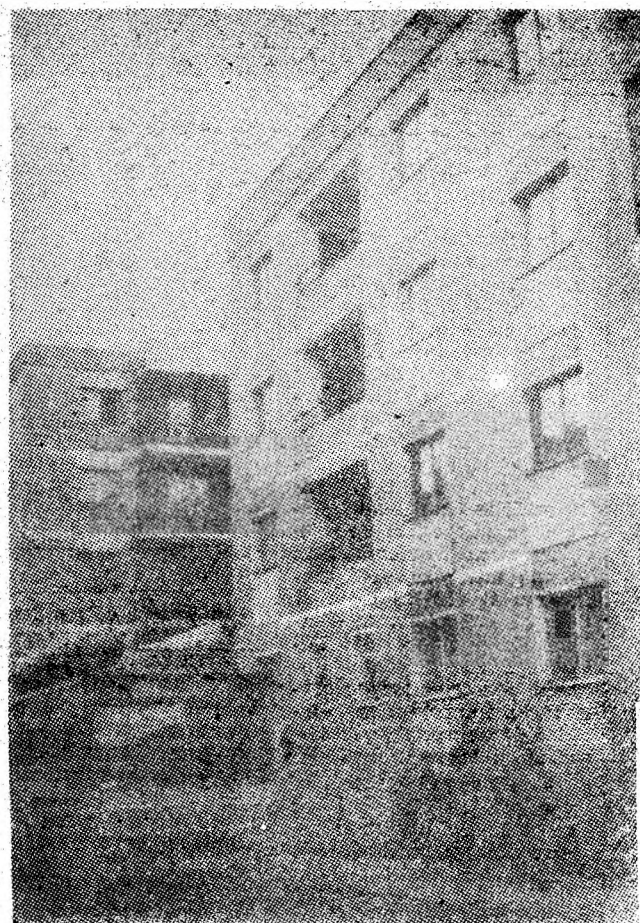
Noi blocuri de locuințe în comuna Aninoasa.

■ ACȚIONAȚI LA LOCUL DE MUNCA, ÎN GOSPODĂRIA DUMNEAVOASTRĂ, în așa fel încît balanța energetică a municipiului să se echilibreze, în așa fel încît consumurile din sectorul casnic să se încadreze strict în cotele alocate !