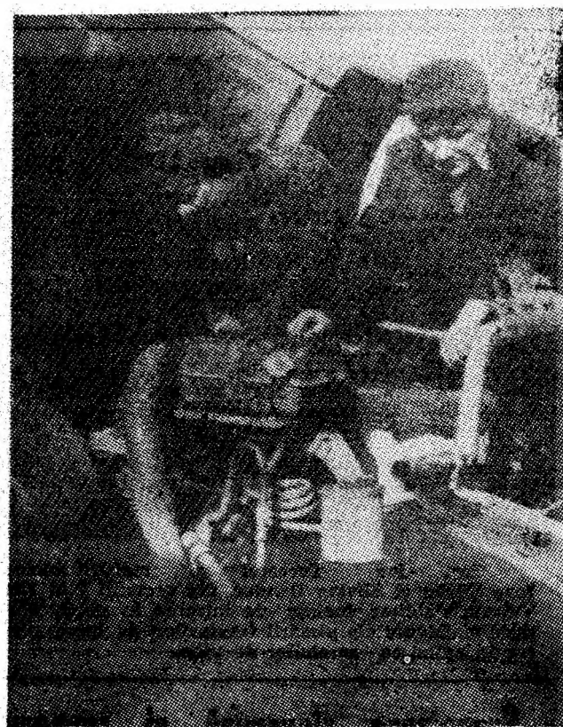
Reparații prompte, de calitate — valențe ale muncii meseriașilor din cadrul atelierului central al SUCTEC Petroșani.

din Petroșani, de exemplu, se află o rulotă a centrului IRVMR. N-a fost deschisă pentru a prelua nici măcar un gram de hîrtie. Acest aspect oglindește însăși atenția manifestată față de încurajarea acțiunii cetățenești de stringere și valorificare a materialelor refofosibile. Pentru revigorarea acestei activități trebuie schimbat în bine (perfecționat) însuși modul de organizare. În final, iată o idee: așa cum se obișnuiește în alte localități din țară, acțiunile de preluare a materialelor trebuie să se desfășoare conform unui program pentru întregul an, iar datele stabilite să fie popularizate astfel ca, prin asociații de locatari ori prin grupuri de blocuri, oamenii să cunoască ziua exactă cînd materialele colectate sînt preluate. Numai astfel, printr-o organizare pînă la amănunt și responsabilitate politică, procesul de recuperare și repunere în circuitul economic a resurselor refofosibile se va intensifica prin contribuția tuturor cetățenilor.