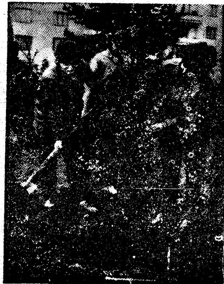
Invitație la înfrumusețarea mediului ambiant.