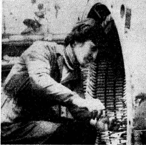
IPSRUEEM Petroșani. Atenție sporită pentru calitatea produselor.

După cum decurg lucrările, după concentrarea de forțe de muncă și de utilaje, se poate aprecia că darea în funcțiune a acestui tronson de cale ferată va fi făcută la termenul stabilit, mai ales că, așa cum arătam, ritmurile de execuție sînt favorizate de o aprovizionare corespunzătoare cu materiale. În felul acesta, se va putea trece la finalizarea, în ritm intens, a altor două obiective feroviare din zonă — tronsoanele Baru — Crivadia și Bănița — Peștera Bolii — care au ca termen de punere în funcțiune sfârșitul trimestrului al III-lea din acest an.