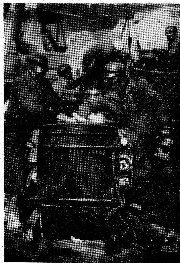
Echipa de lăcătuși condusă de maistrul Ioan Șoncolioș — renumită pentru calitatea lucrărilor la întreprinderea minieră Cimpul lui Neag.