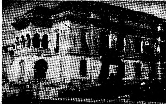
Teatrul de stat Valea Jiului.