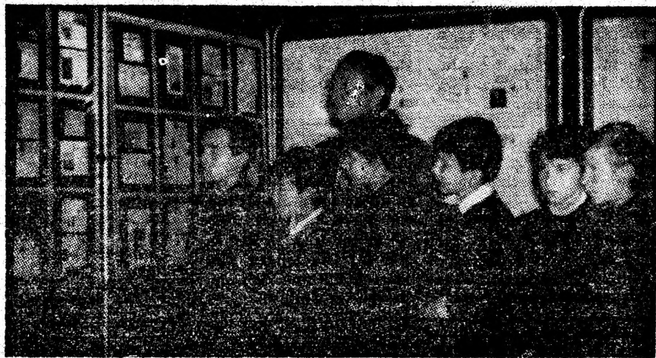
Fleții urmăresc cu viu interes panourile din expoziție.