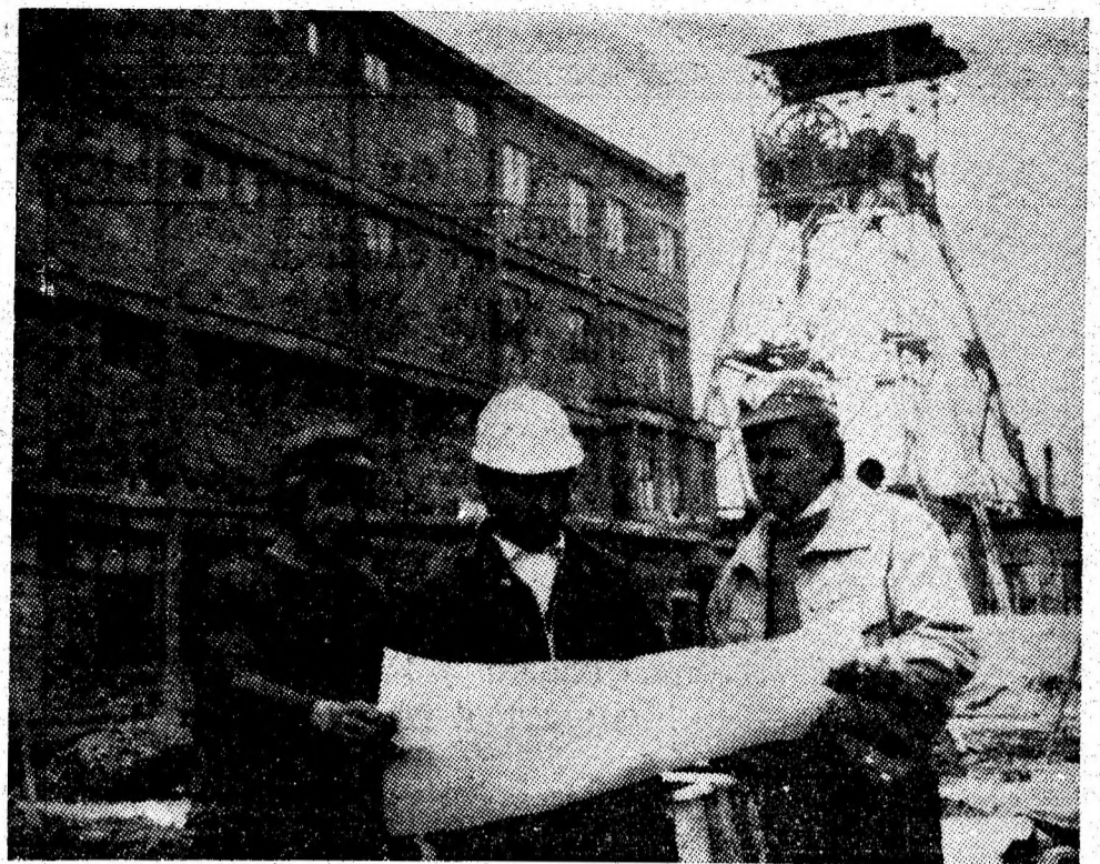
Constructorii — o prezență activă în peisajul mereu înnoitor al Văii Jiului.

parte, capacitatea fiind redeschisă într-o zonă în care a existat foc de mină. „La aceasta, ne spune brigadierul, se adaugă și faptul că aprovizionarea cu materiale nu decurge