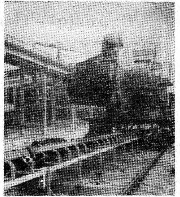
Comandament major pentru colectivul Întreprinderii de Utilaj Minier din Petrosani