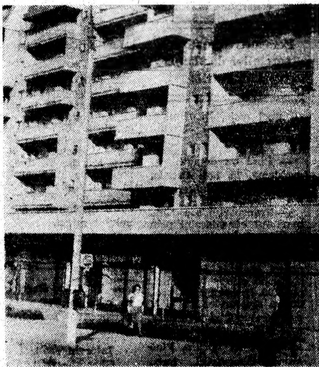
Verticale moderne in orașul Lupeni.

Dar, ceea ce a avut brigada mai important a fost dorința de afirmare, atribuit al demnității minerești, care înseamnă în perspectivă, după spusele înărilor brigadier, nu altceva decît un simplu angajament: 20 000 tone plus pînă la sfîrșitul anului.