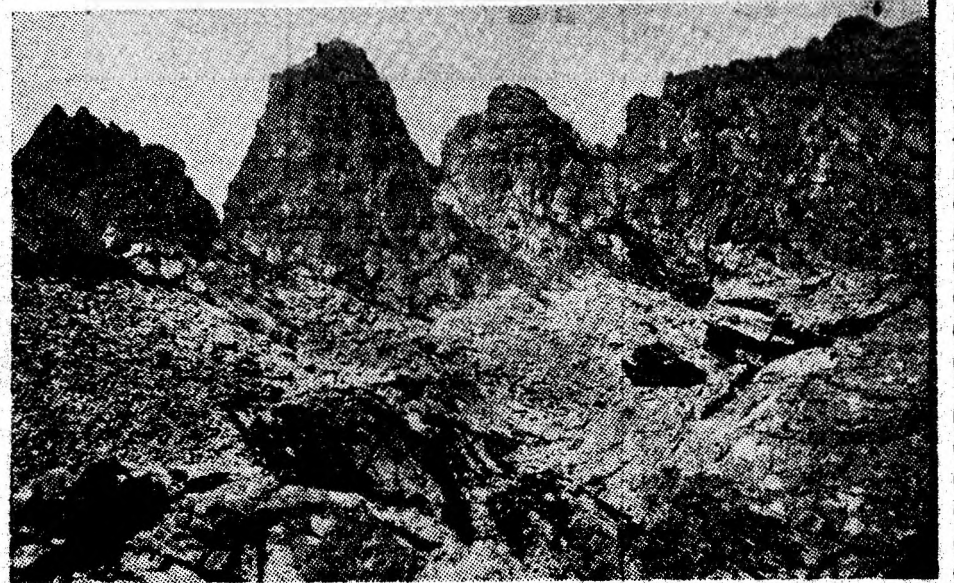
Munții Retezat — „Poarta Bucurii”.