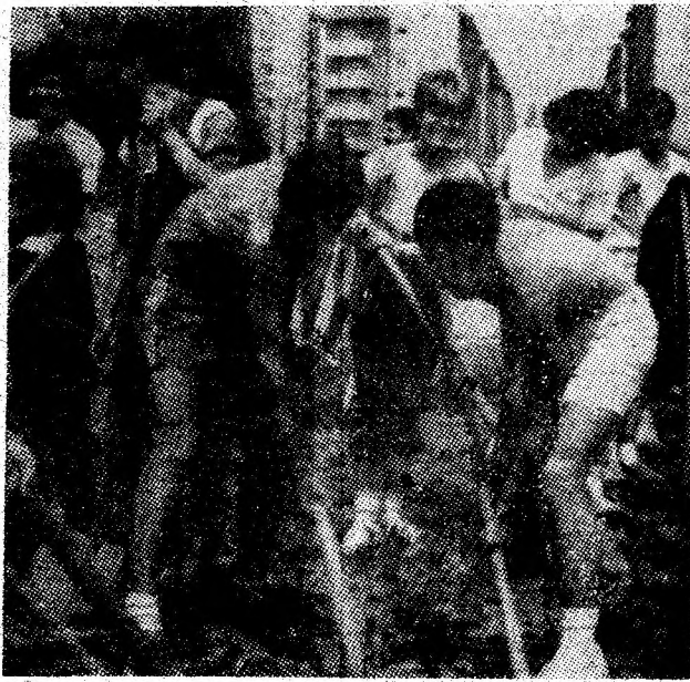
Aspect surprins de fotoreporter la amenajarea amplului spațiu de zonă verde, din reședința municipiului nostru.

Tot din cronică muncii patriotice a tinerilor depusă în aceste zile pe șantiere, amintim prezența detașamentelor purtînd bluze albastre în zonele: gara veche — Lupeni, terenul de tenis de cîmp — Uricani; blocurile de intervenție — Petrila. În curînd și la Preparația Livezeni se va deschide un nou punct de lucru. (H. D.)