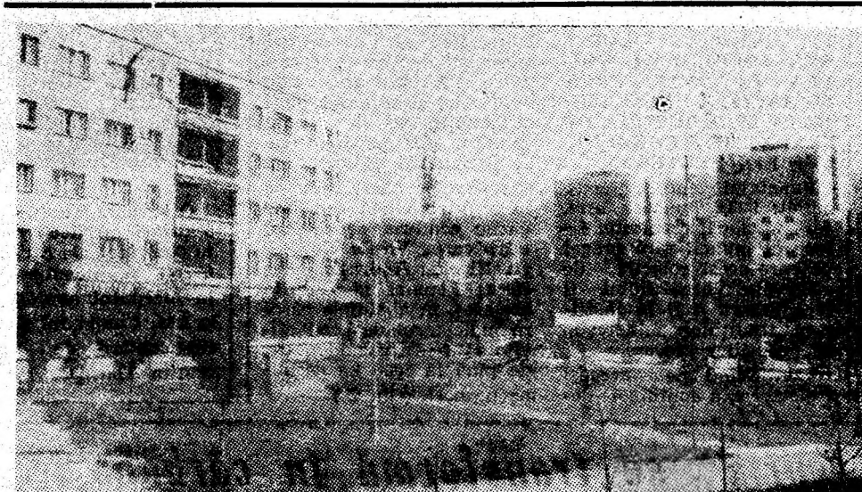
Seventă din Vulcan.

Raportînd îndeplinirea înainte de termen a planului pe 9 luni, colectivul sectorului I al I.M. Lupeni și-a creat premise certe de a mai livra suplimentar, pînă la sfîrșitul acestei luni, încă 500 tone de cărbune. (Gh. OLTEANU)