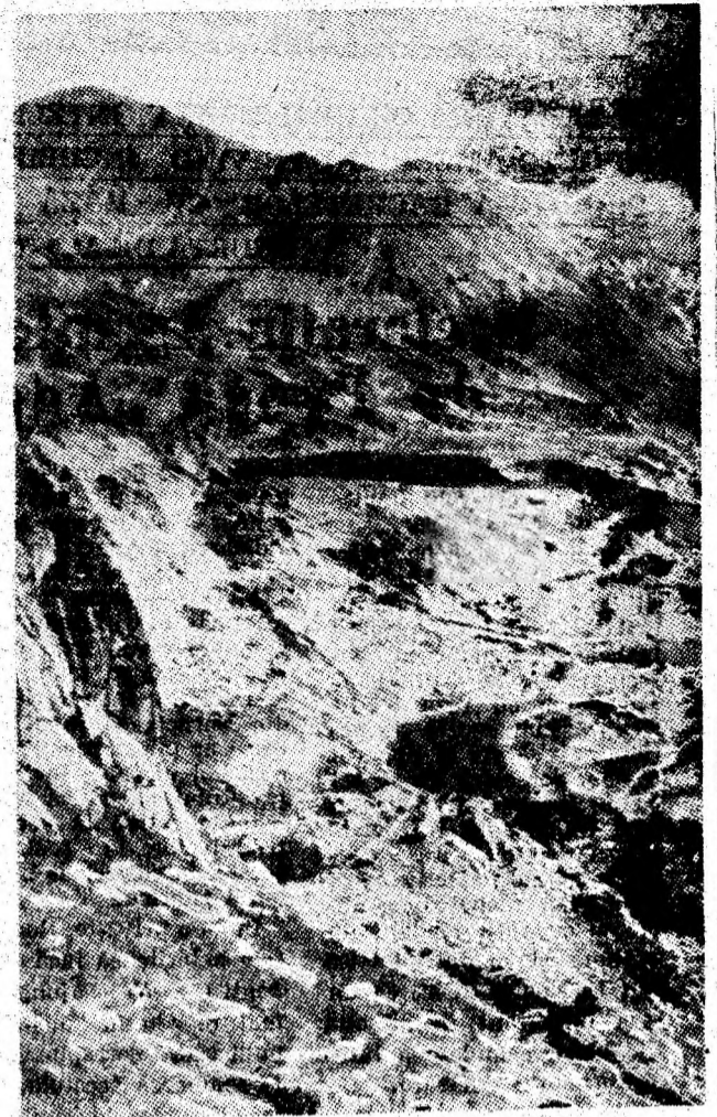
„Căldările Bucurei” din Retezat — un mirific peisaj alpin ce încintă ochii și inima drumeților montaniarzi în toate anotimpurile anului, atrăgându-i irezistibil, în număr mare, spre aceste locuri de basm, de un farmec aparte.

Prudent ca și înaintașii săi, Decebal a urmărit îndepărtarea desfășurării trupelor romane la Sud de Dunăre și a tras concluziile ce se impuneau pentru apărarea țării sale: a accelerat lucrările de fortificație pe tot cuprinsul Daciei și mai cu seamă în zona Sarmizegetusa, inima statului dac. Totodată De-