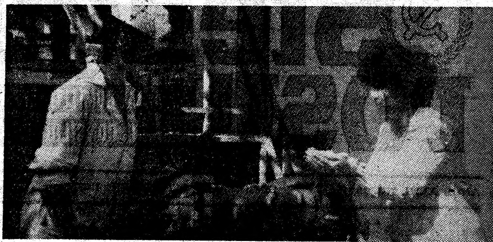
In secția de producere a pufuleților de la Fabrica de morărit și panificație Petroșani.