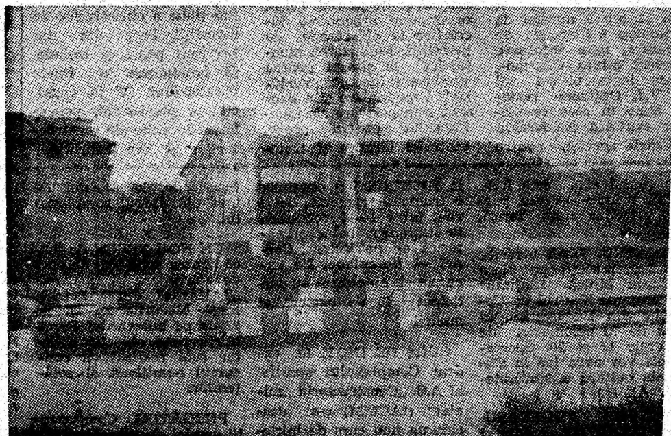
Piața Victoriei, din reședința municipiului, în haina înnoirilor edilitare.