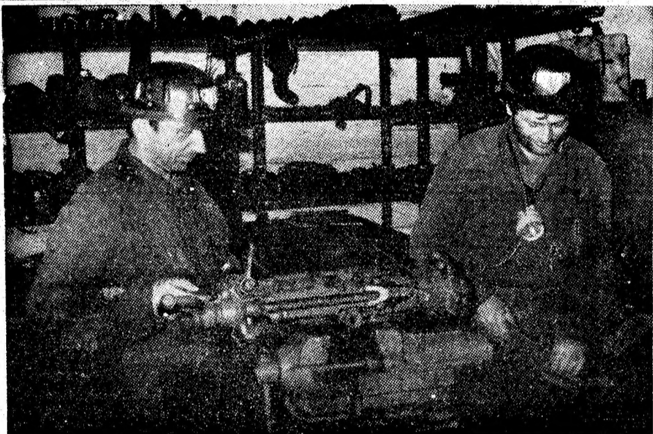
Atelierul de reparații service ce funcționează în subteran la I.M. Petrița.

teres public, cristalizîndu-se concluzii de ordin practic prin participarea tuturor la dezvoltarea și mai buna gospodărire a localităților. Dialogurile electorale, care vor începe prin adunările cetățenești consacrate depunerii candidaturilor pentru alegerile de deputați în consiliile populare municipale, orașenești și comunale, se vor aprofunda prin dezbateri privind dezvoltarea pres-tărilor de servicii și mi-cii industriei, colectarea și valorificarea materiilor prime și materialelor, asupra perspectivelor edilitar-gospodărești, fiind un prilej de adîncire a democrației socialiste, a implicării responsabile, cu înalt spirit civic, în întreaga viață socială, economică a localităților Văii Jiului.