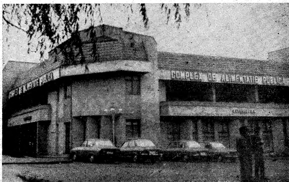
Complexul de alimentație publică din Lupeni.