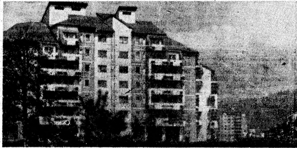
Petroșani-Nord, o prestigioasă emblemă pe cartea de vizită a reședinței de municipiu.