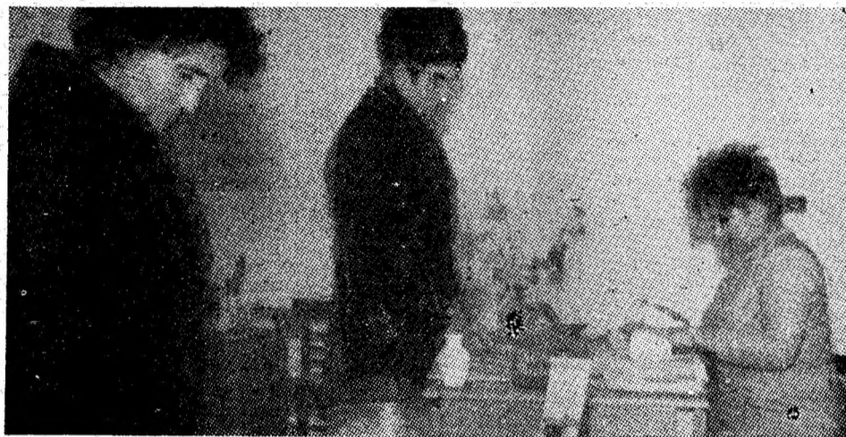
În noul local al filialei din Petroșani a OJT.

Rezultatele obținute în domeniul demografic ilustrează grija permanentă pe care partidul și statul nostru socialist o acordă întăririi familiei, sporirii natalității și creșterii unor generații sănătoase — cerință esențială a menținerii tinereții și vigoriei națiunii noastre.