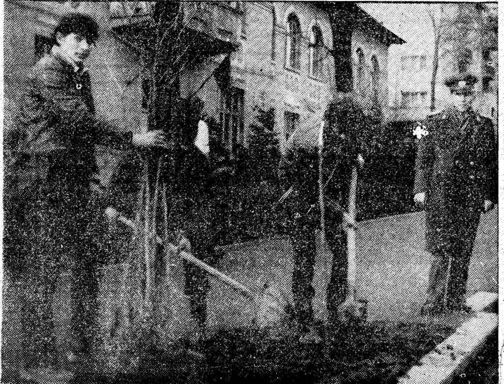
În prezența organelor de miliție și a dezaprobării generale a trecătorilor, cei trei răufăcători au fost siliți să replanteze pomii distruși.