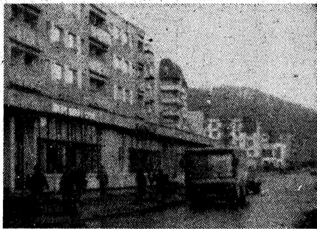
Noi mărturii ale urbanisticii moderne din orașul Lupeni.

O poveste cu cîntec. De cîțiva ani buni, chiar de la început, adică de cînd s-a construit, a fost cu cîntec. Adică, șubred, nesigur, descoperit. Este vorba despre gura de canalizare, de pe noua arteră de circulație a Petroșaniului — Alea Poporului, chiar în dreptul cinematograful „Paringul”. A fost îndeajuns să o „calce” roțile camioanelor și capacul s-a spart, cadrul de fontă a crăpat, apoi s-a sfărîmat, cu zidul de beton cu tot. Apoi a fost reconstruit... dar iar s-a spart, sau a dispărut capacul, și gura de canal deschisă a fost o capcană atît pentru pietoni cit și pentru mașini.