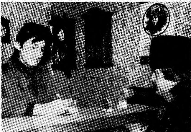
Aspect din unitatea nr. 40 „Ceasornicărie” a Cooperativei „Unirea” Petroșani.

Climatul de muncă sănătos, angajarea fermă a colectivului nostru, în frunte cu comunistii, se regăsesc în învingerea vicisitudinilor iernii, în devansarea termenelor pentru asigurarea viitoarelor capacități de producție și folosirea zestrei tehnice, constituind premise sigure pentru realizarea sarcinilor sporite ce ne revin în acest an.